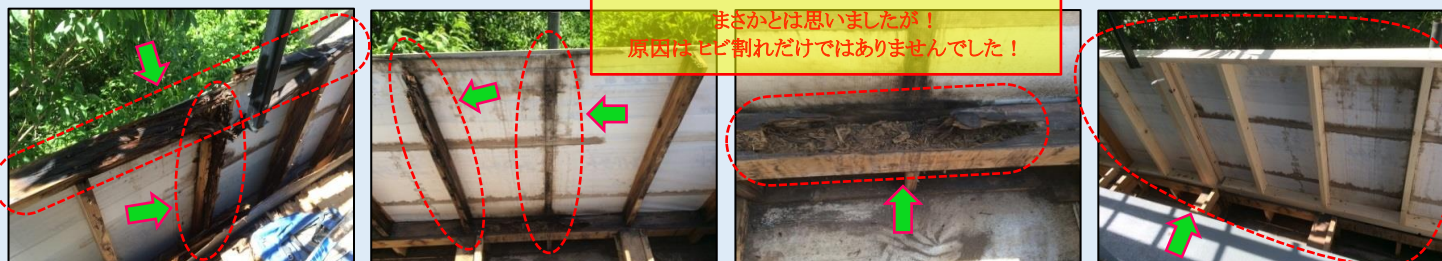
柱等の木部腐食状況

築13年の戸建のバルコニーで！なぜこんな被害が起きたのか？日本屈指の建売業者の見えない部分の施工の実態お見せします！