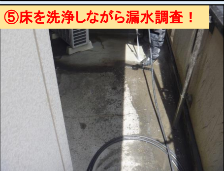
⑤床を洗浄しながら漏水調査！