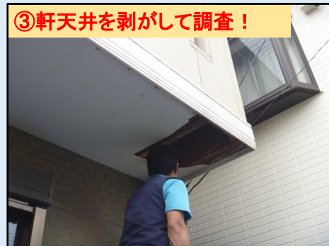
③軒天井を剥がして調査！