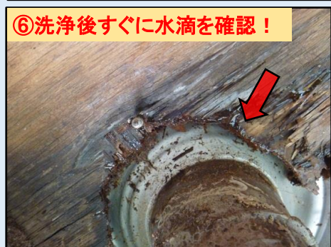
⑥洗浄後すぐに水滴を確認！