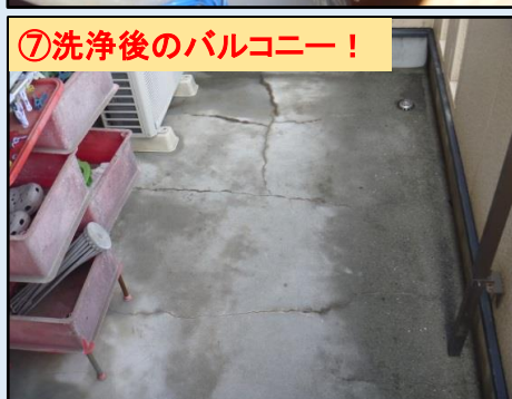
⑦洗浄後のバルコニー！