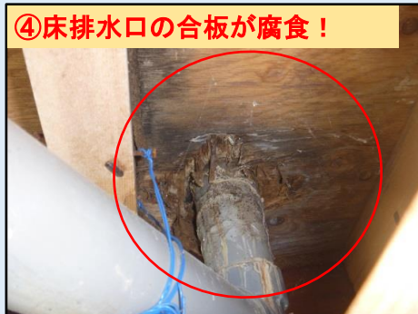
④床排水口の合板が腐食！