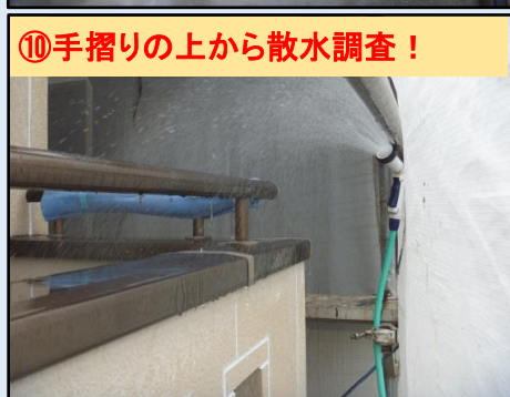
⑩手摺りの上から散水調査！