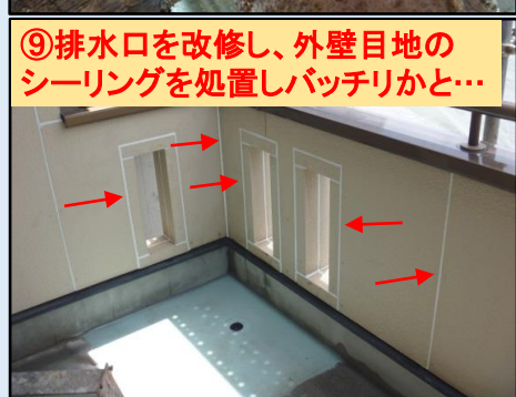
⑨排水口を改修し、外壁目地のシーリングを処置しパッチリかと…