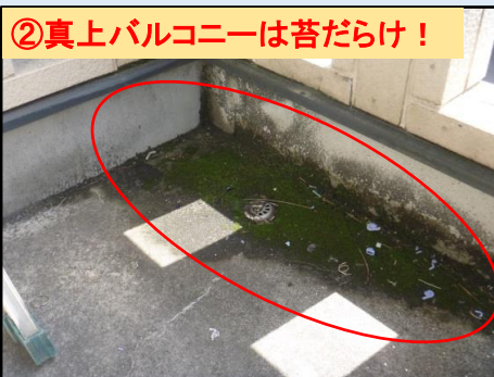
②真上バルコニーは苔だらけ！